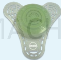
绿保洁™ Bio Tabs® Green