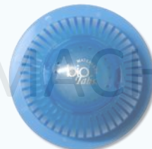
大蓝菌菇™ Bio Tabs® Bug Sphere