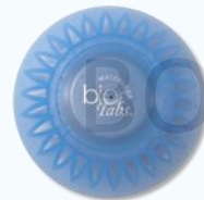
中蓝菌菇™ Bio Tabs® Blue Dome