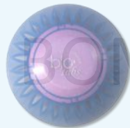
红保洁™ Bio Tabs® Pink